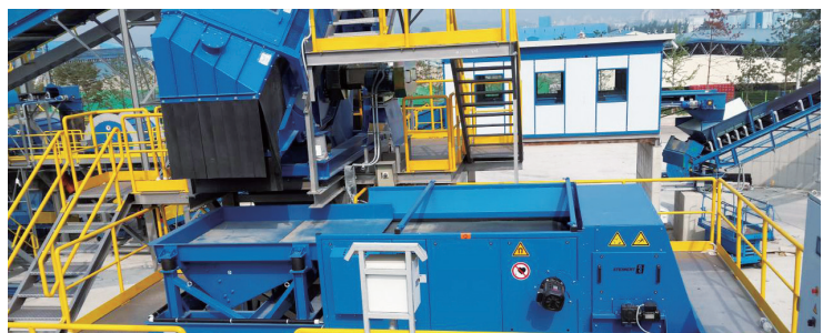
와류선별시설 Eddy Current Separator 비자성금속 내에 발생한 와전류의 반발력의 차이를 이용하여 비철금속을 분기 선별