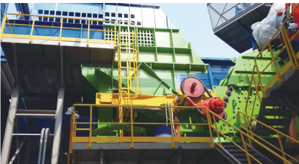
파분쇄기 Shredder 폐자동차를 10~15cm 크기로 파분쇄