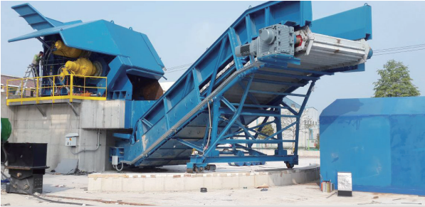
프리슈레더 Pre-Shredder 폐자동차를 50cm 크기로 절단