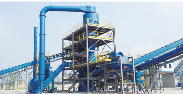
케스케이드 에어시스템 Cascade Air System 저망간 스크랩과 경량 파분쇄를 비중차로 분리 선별