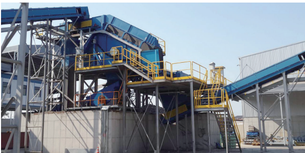
자력 및 진동스크린 선별시설 Magnatic and Vibration Screen Drum 자성특성을 이용한 스크랩과 비철 분리선별 40mm크기의 진동스크린망으로 파쇄물 분리 선별